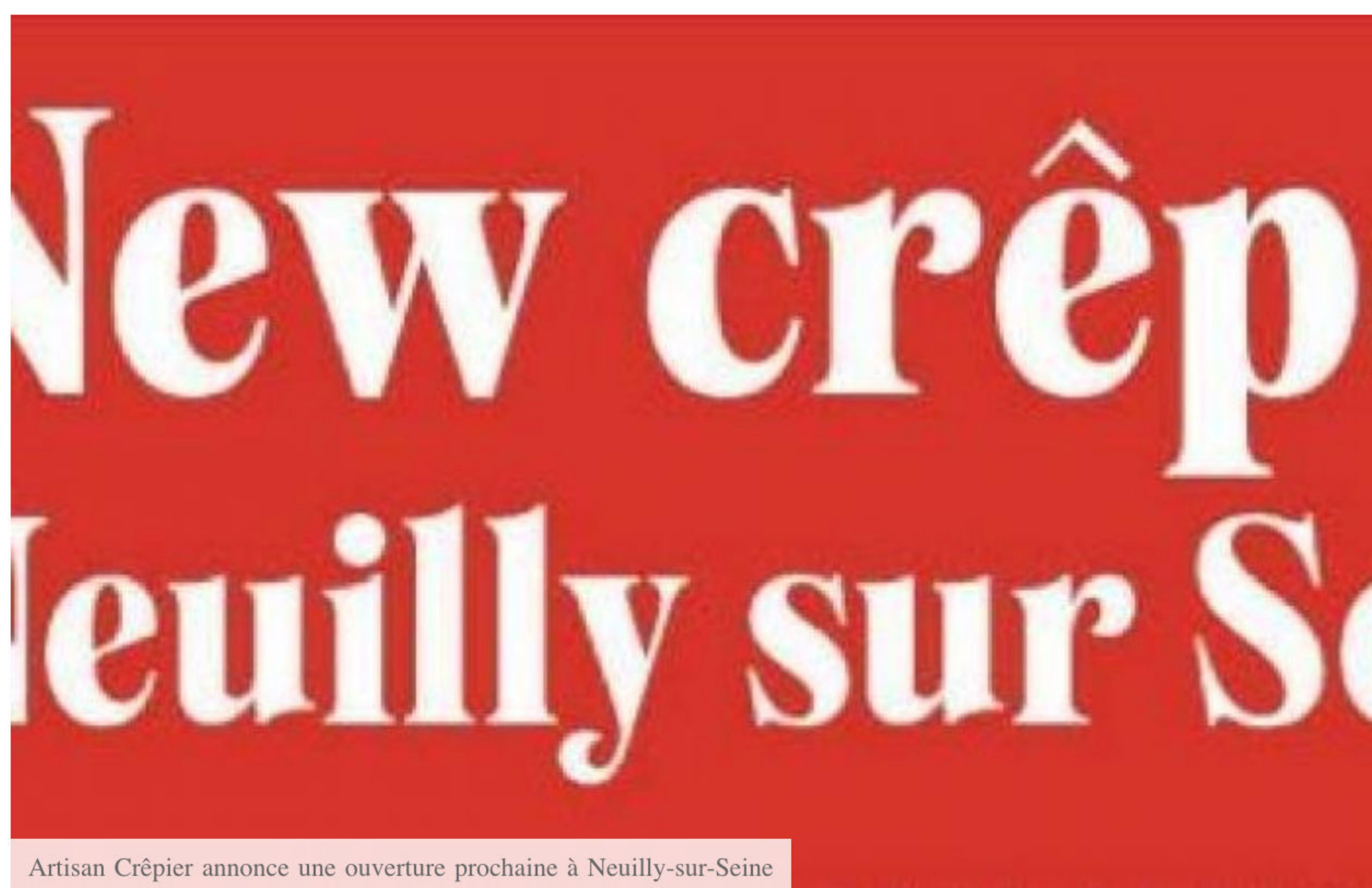
Artisan Crêpier annonce une ouverture prochaine à Neuilly-sur-Seine

Acteur incontournable du marché de la crêperie, L'Atelier – Crêpier Artisan continue de déployer son réseau en réalisant de nouvelles ouvertures. D'ailleurs, une prochaine ouverture est prévue pour l'été 2024.